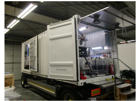
Abbildungen können vom Original abweichen